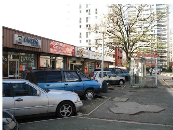
Polarité Les Musiciens