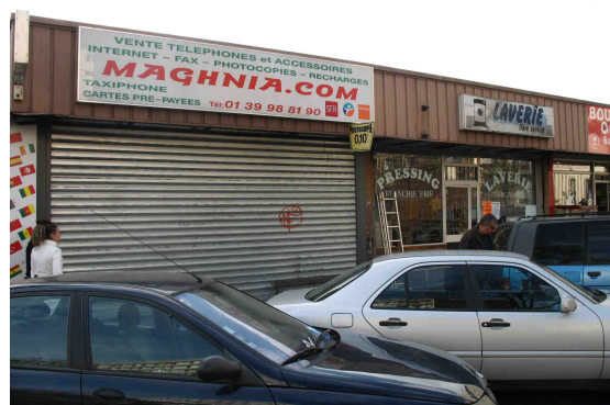
Polarité Les Musiciens