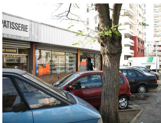
Polarité Les Musiciens