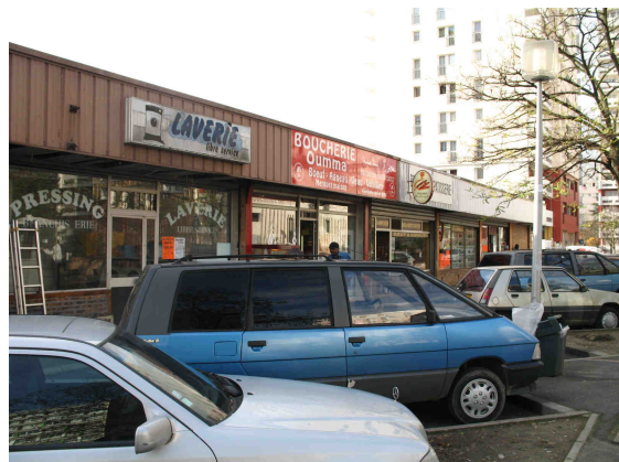
Polarité Les Musiciens