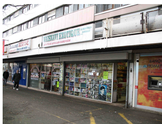
Rue commerçante face au supermarché