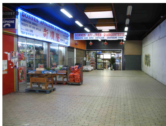
Galerie commerciale attenante au supermarché