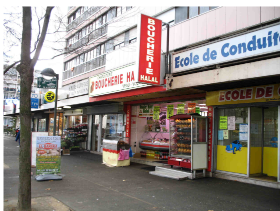
Rue commerçante face au supermarché