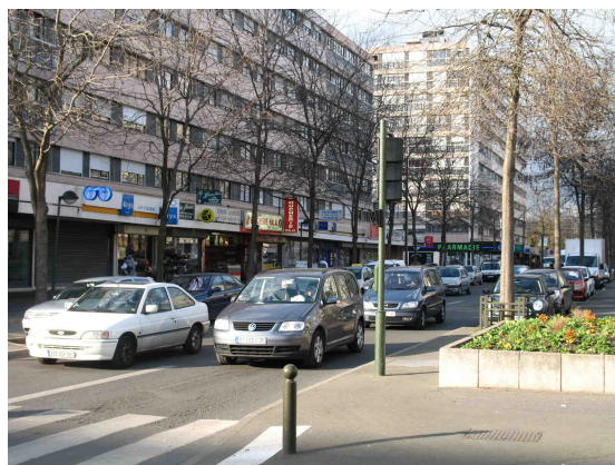
Rue commerçante face au supermarché