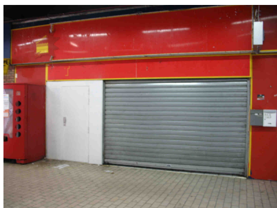
Galerie commerciale attenante au supermarché