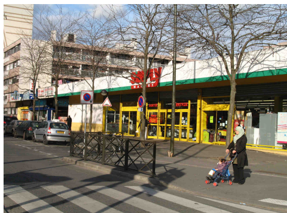
Entrée du Simply Market