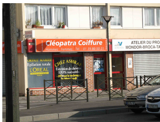
Rue du Lieutenant-colonel Proudhon – Coiffeur