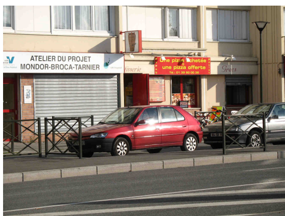
Rue du Lieutenant-colonel Proudhon – Restauration rapide