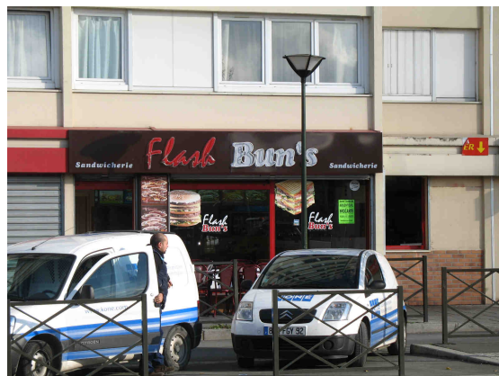
Rue du Lieutenant-colonel Proudhon – Restauration rapide