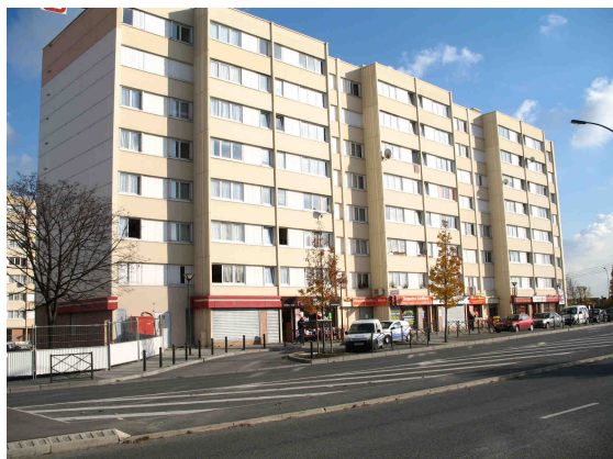
Rue du Lieutenant-colonel Proudhon - Vue d'ensemble