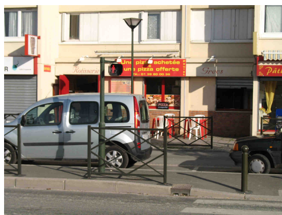
Rue du Lieutenant-colonel Proudhon – Restauration rapide