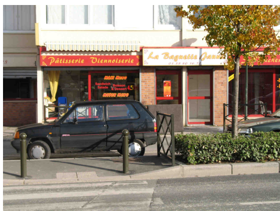
Rue du Lieutenant-colonel Proudhon – Terminal de cuisson