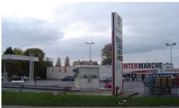
Intermarché – Rue Monthermé