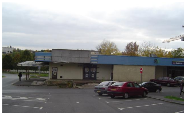
Centre commercial fermé – Rue Chopin