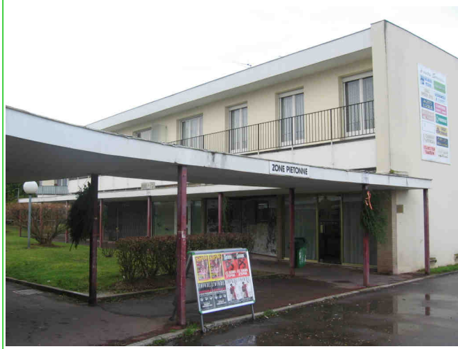
1. Centre commercial Le Cygne (bâtiment A)