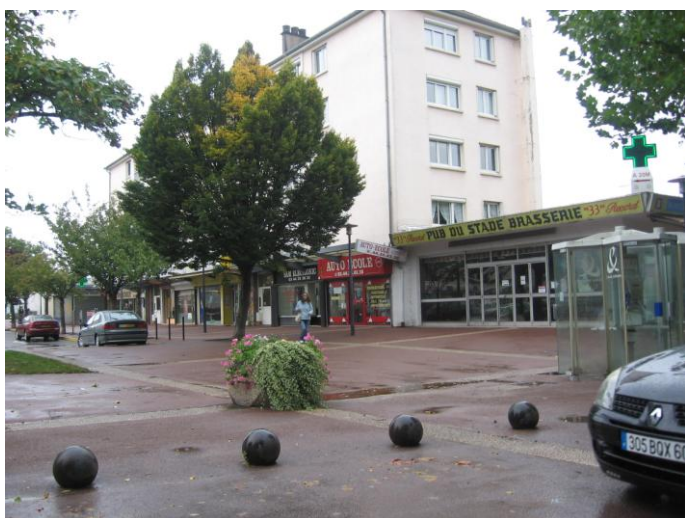
Commerces place de l'Eglise