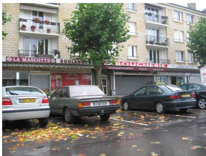
Commerces rue Madeleine Blin