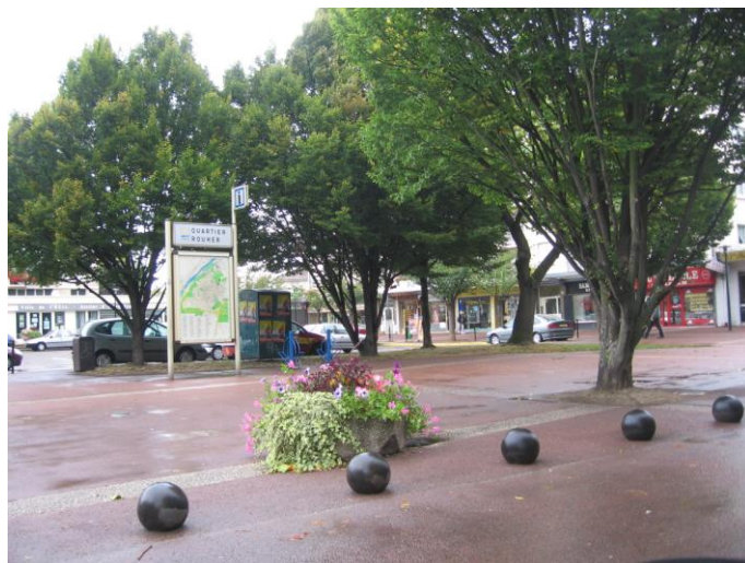
Place de l'Eglise