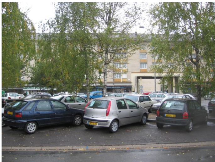
Place de l'Eglise