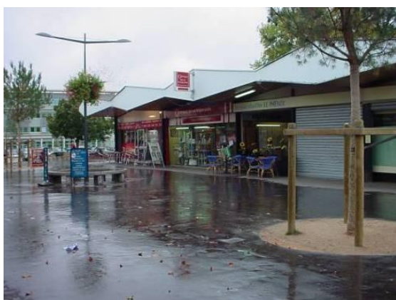
Centre commercial Kennedy