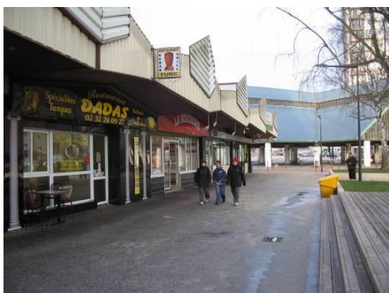
Centre commercial Kennedy