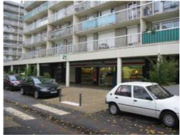
Rue Eugène Boudin – Coccimarket