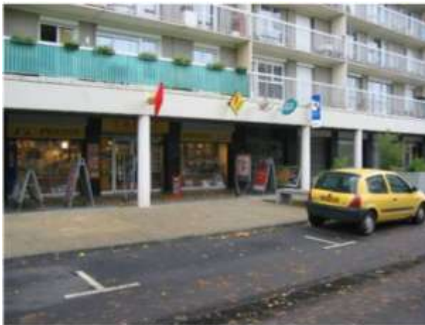
Rue Eugène Boudin – Tabac Presse