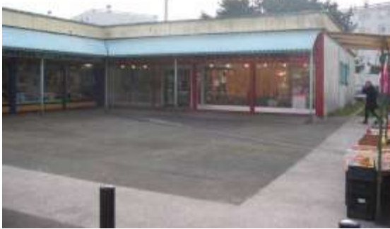
Vue du centre commercial