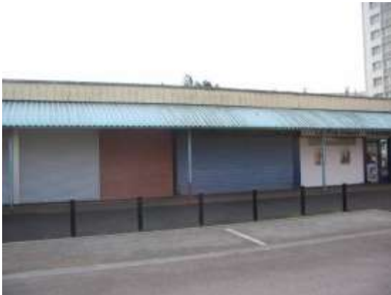
Vue de l'école d'Arts Martiaux