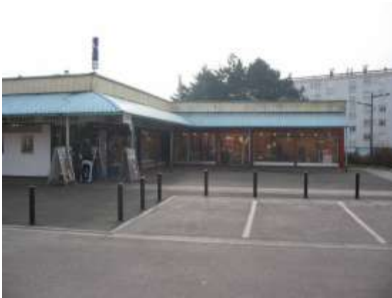
Vue du centre commercial prise du parking