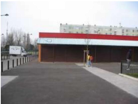
Vue de l'ancien Mutant