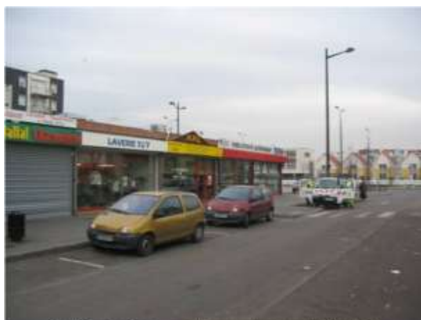
Rue Françoise Sagan – vue de l'ensemble commercial (Nord Est)