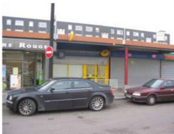
Rue Françoise Sagan – La Poste et la Pharmacie (Est)