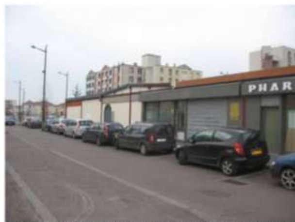
Rue Françoise Sagan – le cabinet de soins et l'association culturelle islamique (Est)