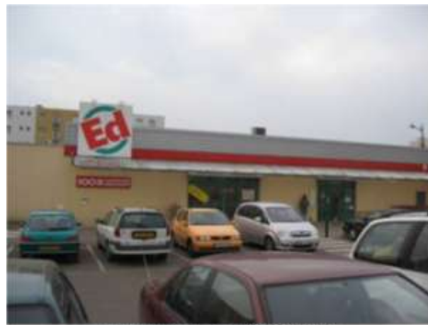
Rue Henri Cayeux – vue du parking ED (Nord)