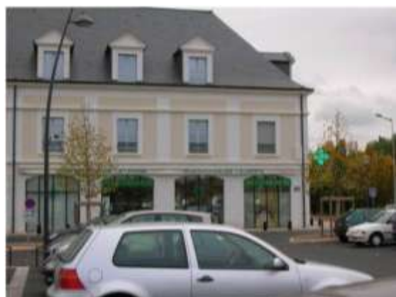
Pharmacie – Place Bernard Lorjou