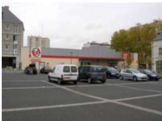
Supermarché ED – Place Bernard Lorjou