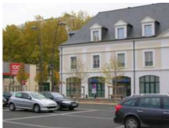
Place Bernard Lorjou – côté Est