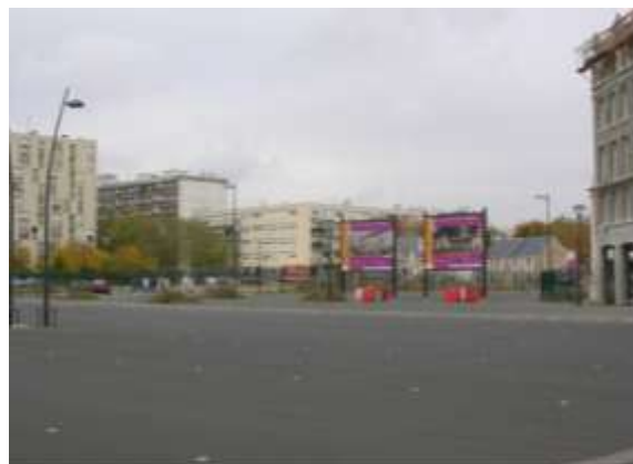
Vue du parking – Place Bernard Lorjou