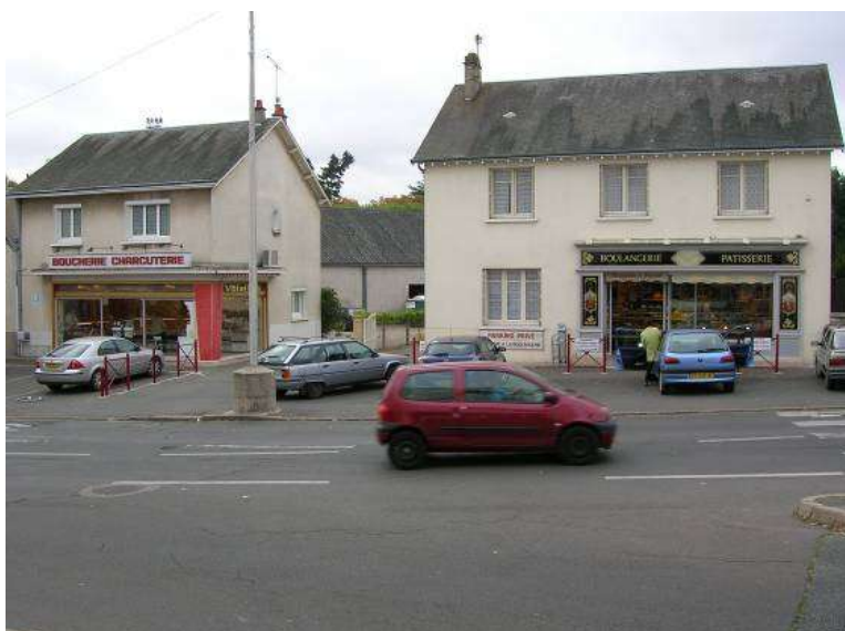
Boucherie-Charcuterie et Boulangerie-Pâtisserie