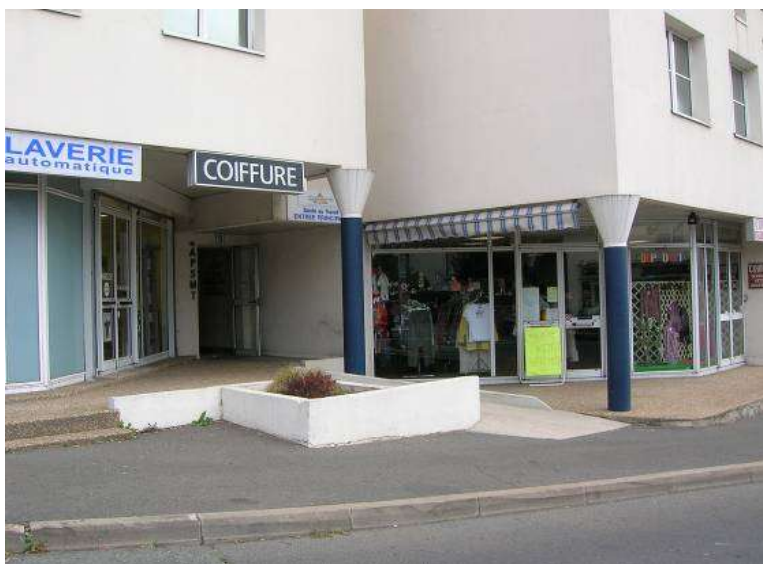
Laverie, Salon de coiffure et Dépôt- vente de vêtements