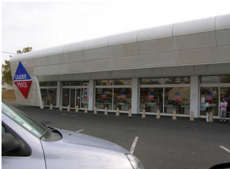
Supermarché Leader Price