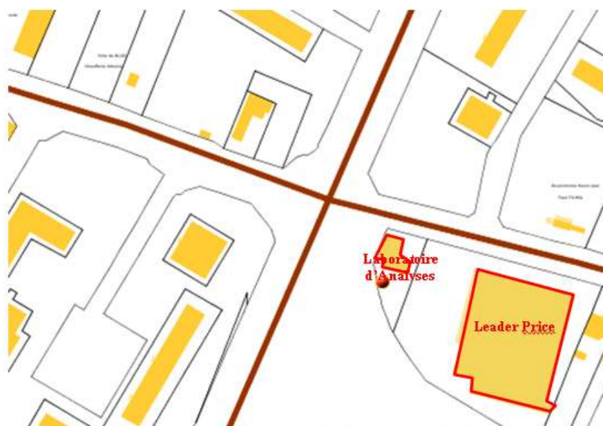
Plan de composition commerciale (1)

Feuille 000 AK 01