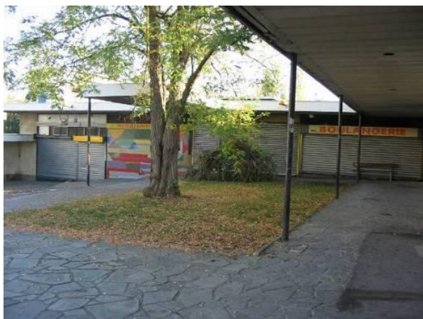
Vue du parking