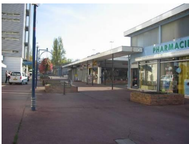
Pharmacie et bureau de tabac