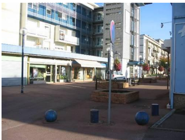
Primeurs et salon de coiffure