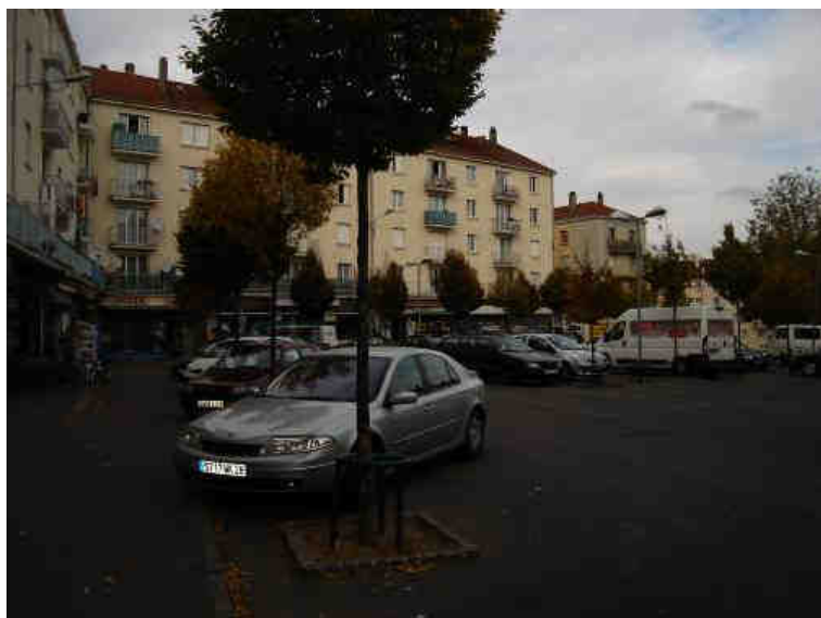
Parking de l'espace commercial Le Moulec