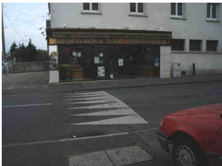
Vue de la rue Monronval