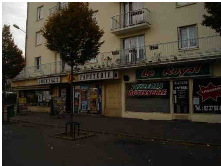
Place du 8 mai 1945