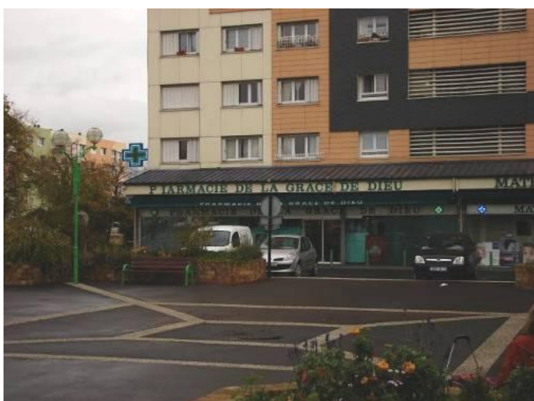
Place piétonne du Point du jour