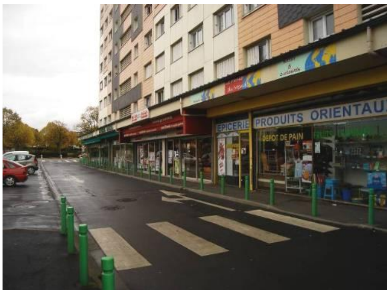
Bâtiment Est de la Place du commerce