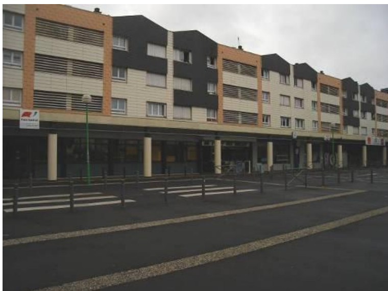
Bâtiment Sud de la Place du commerce