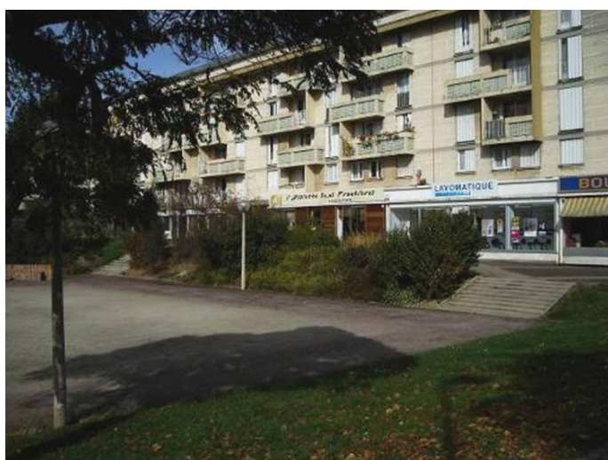
Bâtiments Ouest de la Place de la Liberté