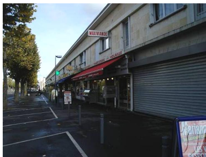
Bâtiments Est de la Place de la Liberté