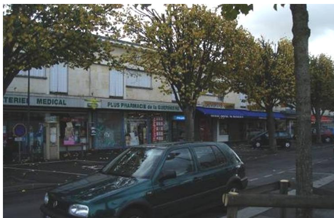
Bâtiments Ouest de la Place de la Liberté