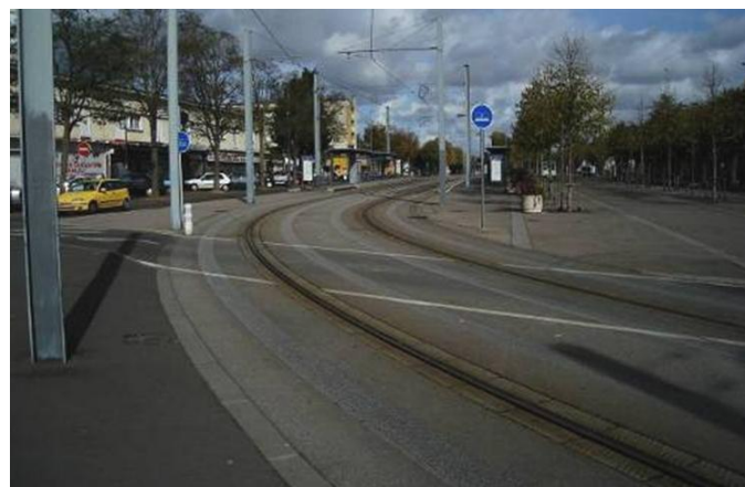
Espace central du pôle commercial de la Guérinière