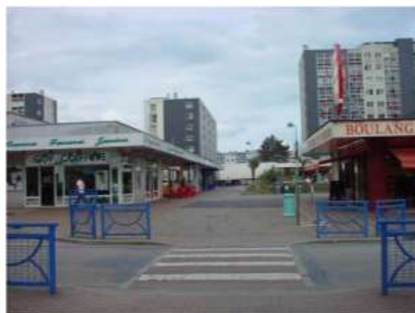
Accès banalisé vers le pôle commercial de l'Avenue de Normandie