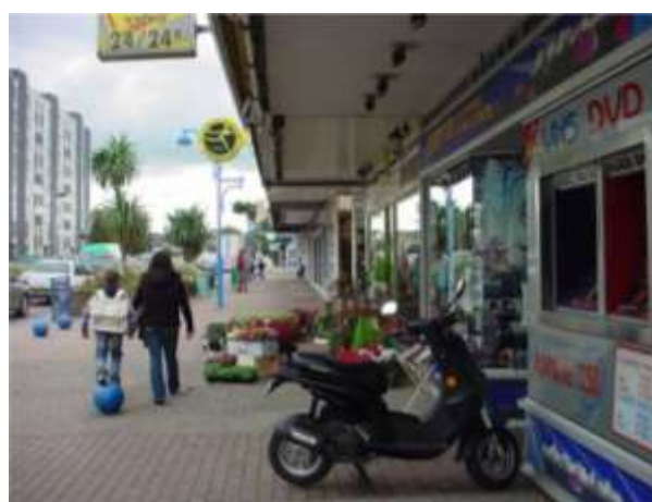
Commerces situés le long de l'Avenue de Normandie