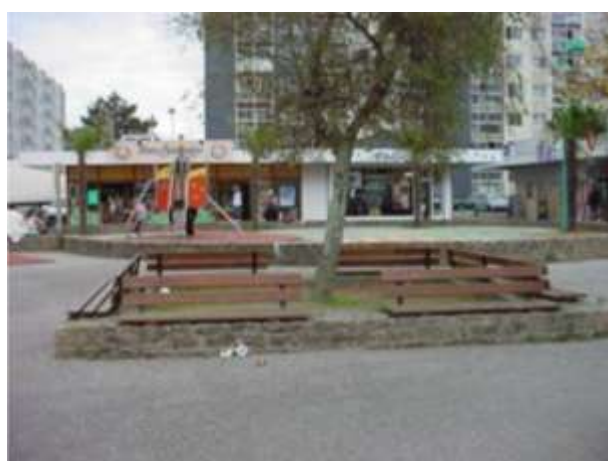
Place piétonne de l'espace commercial des Provinces