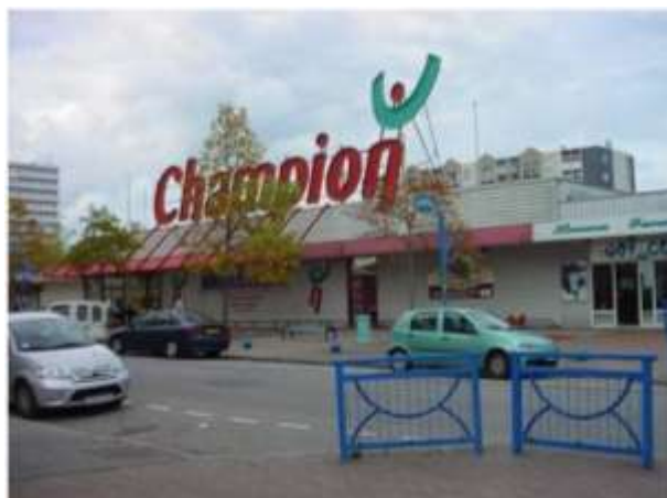
Locomotive commerciale alimentaire