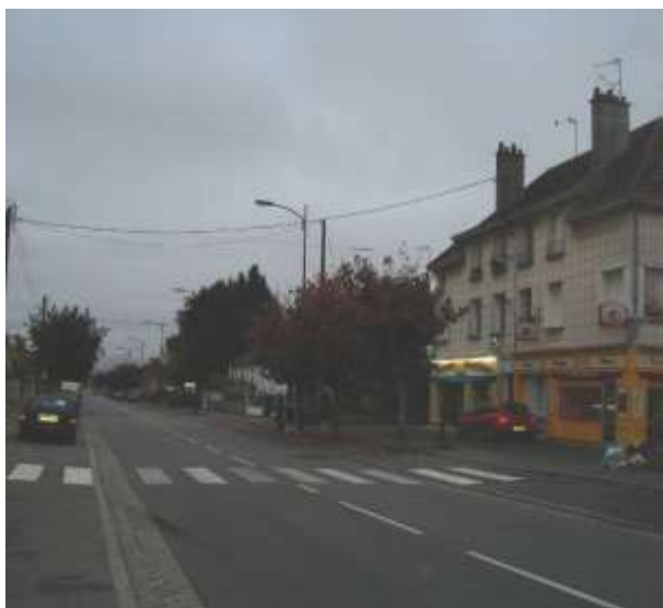
Vue de l'avenue