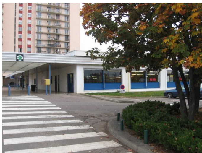
Vue du magasin Lidl