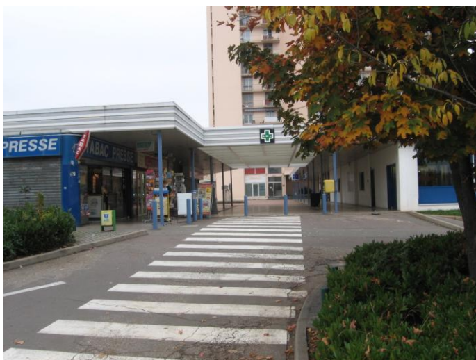
Vue de l'entrée du centre commercial Kennedy