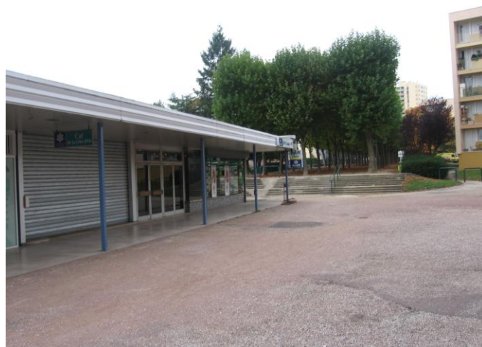
Vues du centre commercial Kennedy