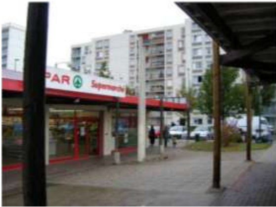
Locomotive alimentaire SPAR