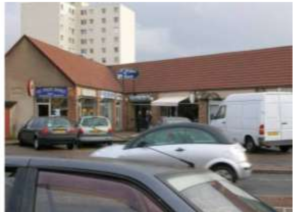
Rue de Coubertin – Centre du Clos St Pierre