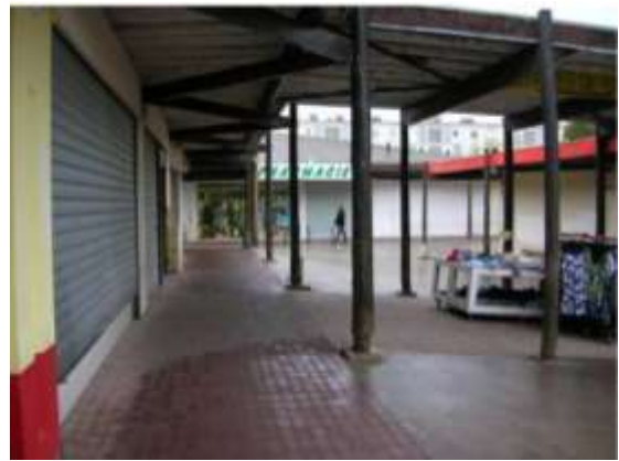
CC Champs Plaisants