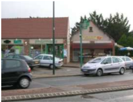
Rue de Coubertin – Centre du Clos St Pierre