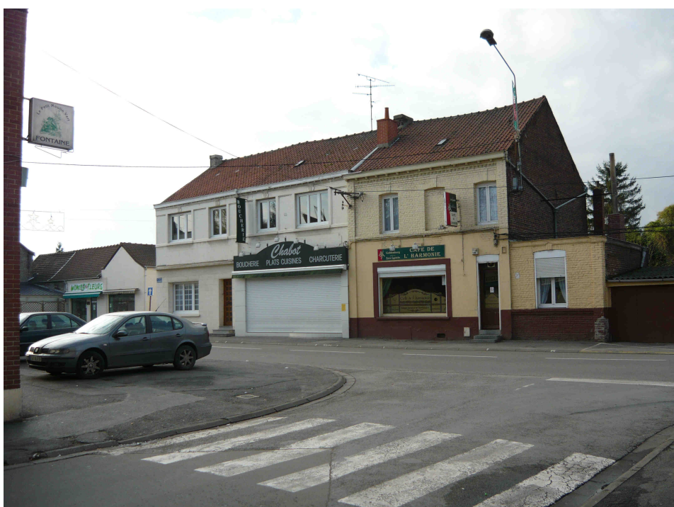
Place du Onze Novembre (Polarité 1)