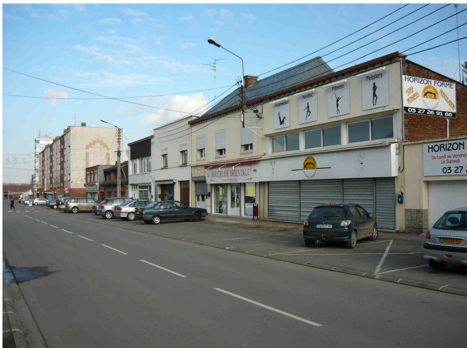
Place du Onze Novembre (Polarité 1)