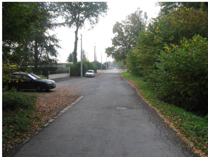
Axe de desserte interne au quartier, Av. de la Malanoye