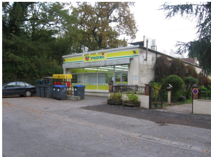
Proxi, Avenue de la Malanoye