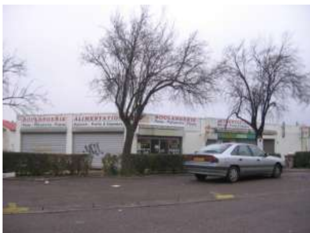
Snack Pizza Frat