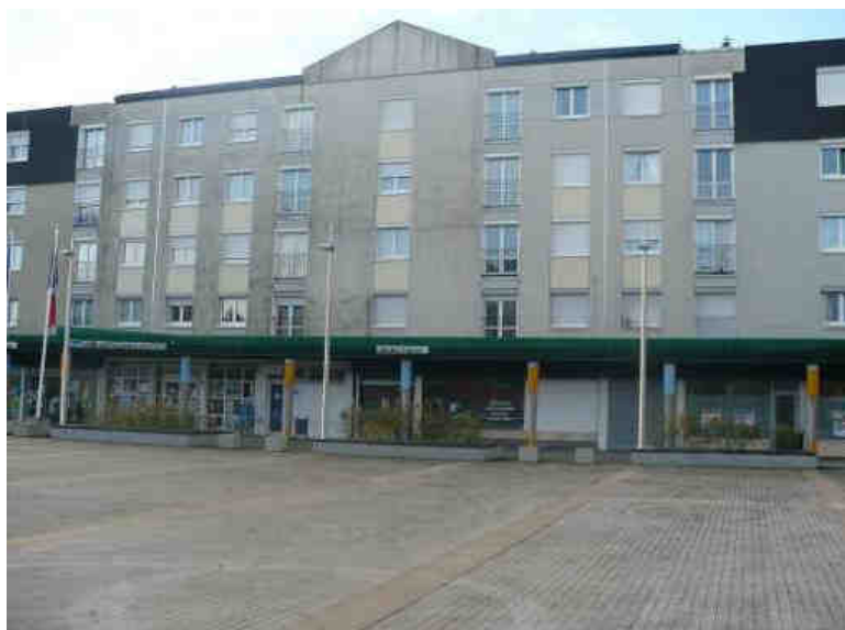
Linéaire commercial vu de la Place des Lauriers