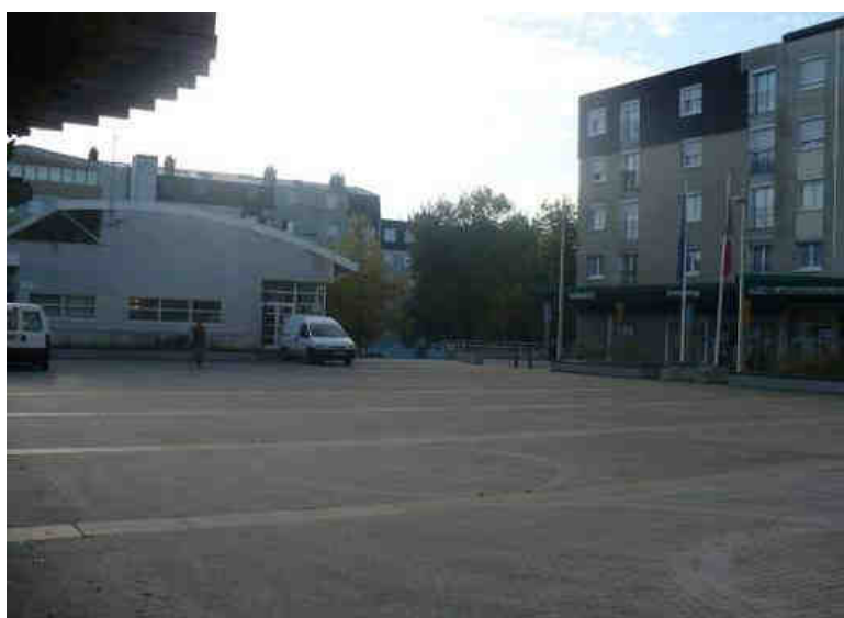
Place des Lauriers