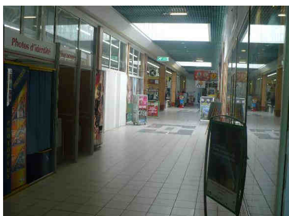
Centre commercial Esplanade - Vue des parties communes