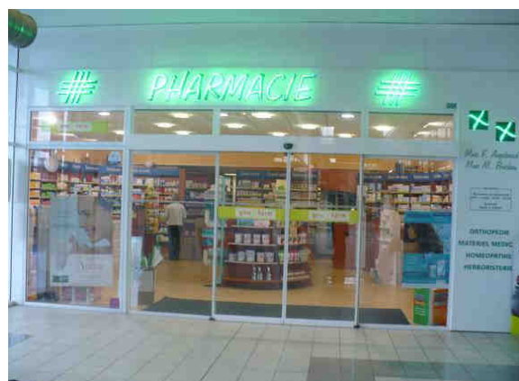
Centre commercial Esplanade - Vue de la pharmacie