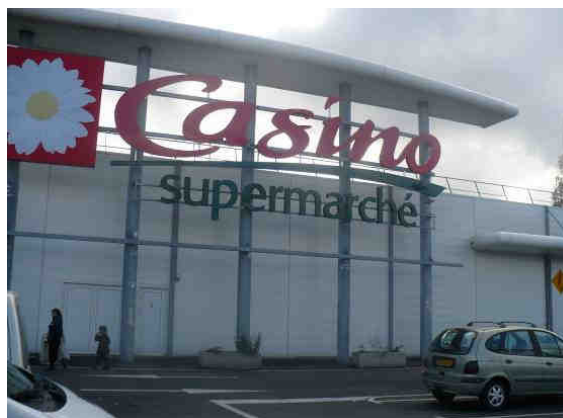
Centre commercial Esplanade - Vue du supermarché Casino