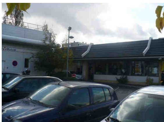
Centre commercial Esplanade - Vue du Mc Donald's