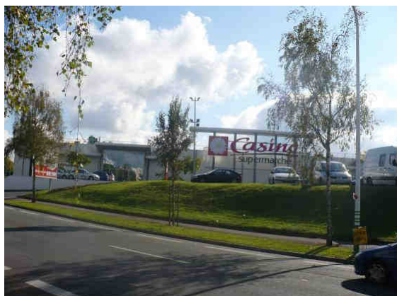
Centre commercial Esplanade - Vue d'ensemble