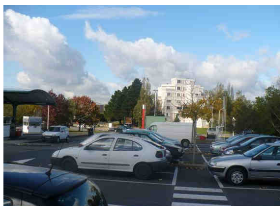
Centre commercial Esplanade - Vue du parking