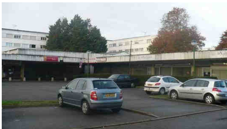
Centre commercial vu du parking