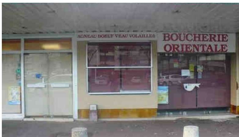
Devanture de commerce