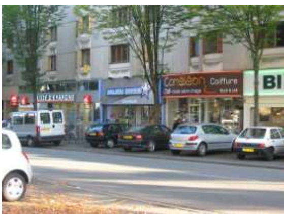
Vue d'un côté de l'Avenue Patton