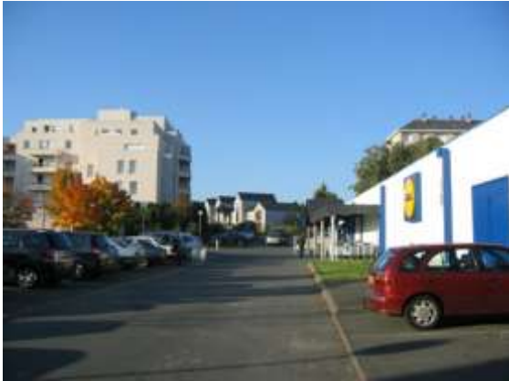
Vue du LIDL