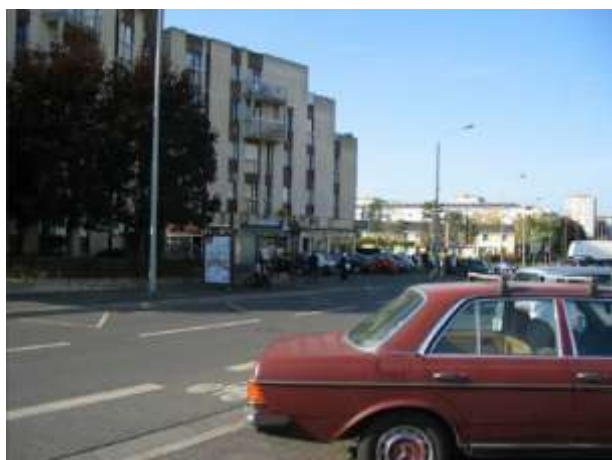
Vue du boulevard Auguste Allonneau (côté est)