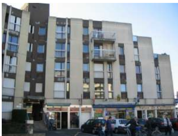
Vue du boulevard Auguste Allonneau (côté ouest)