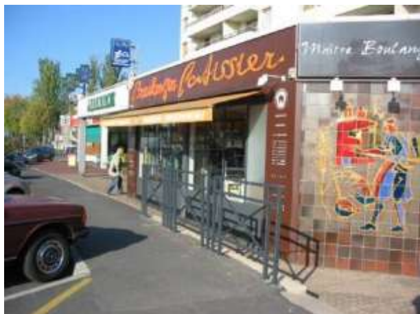
Vue du linéaire commercial