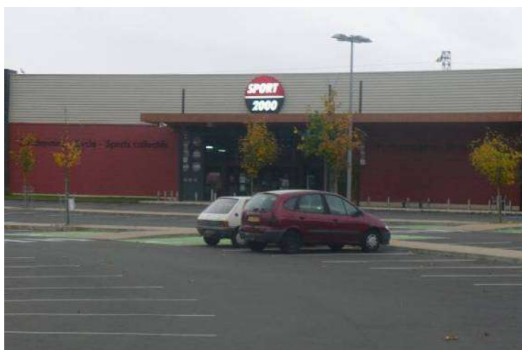
Vue du parking d'Aria parc