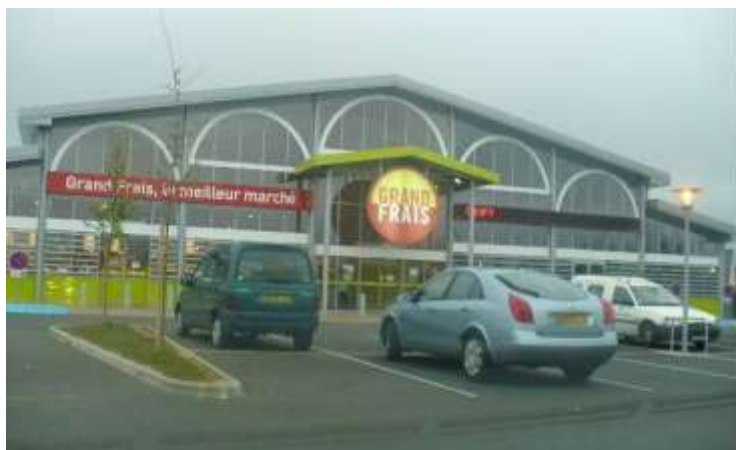
Vue de la locomotive alimentaire