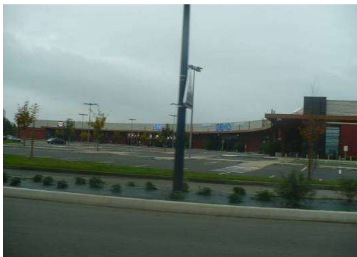
Vue du parking d'Aria parc