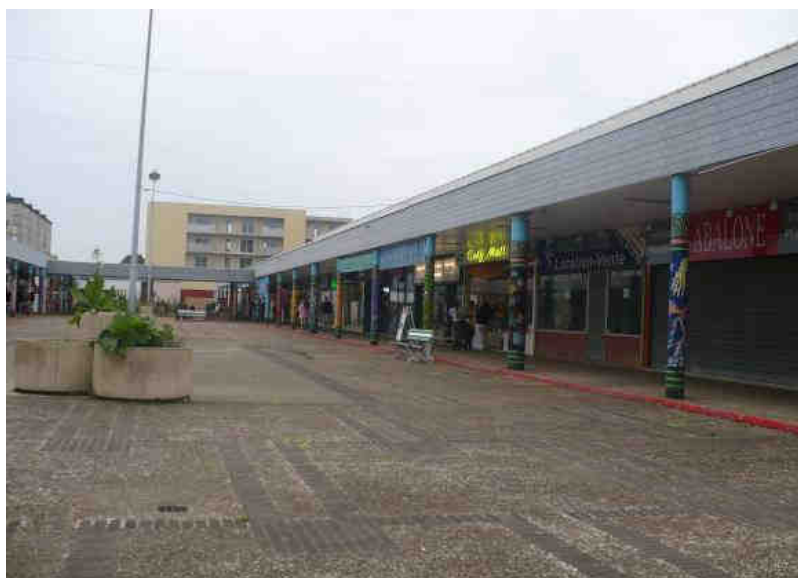
Vue du Mail