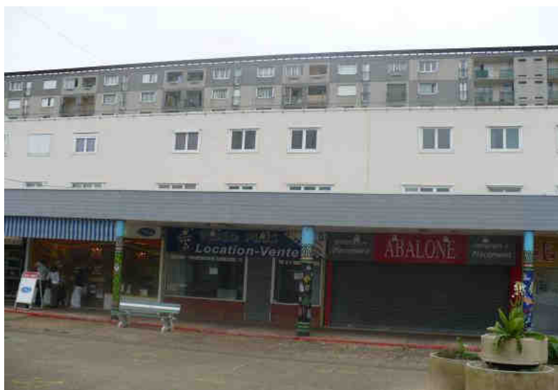
Une partie du linéaire commercial vu de la place