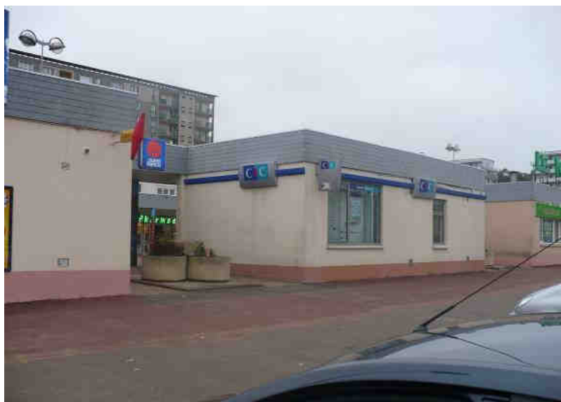
Vue du parking