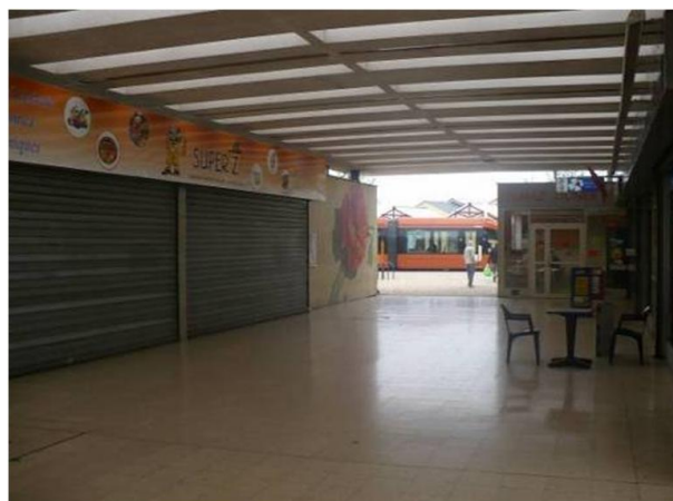
Vue de la locomotive alimentaire (actuellement fermée)