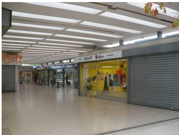
Vue de la galerie de l'Epau