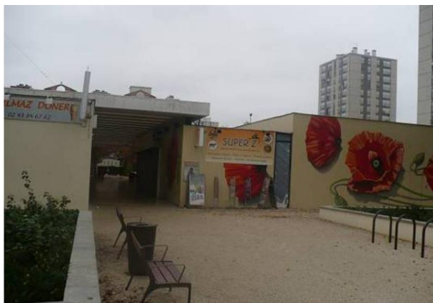
Vue du Centre Commercial de l'Epau côté Rue Esterel