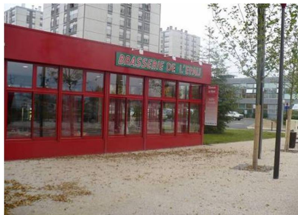
Vue de la Brasserie de l'Epau