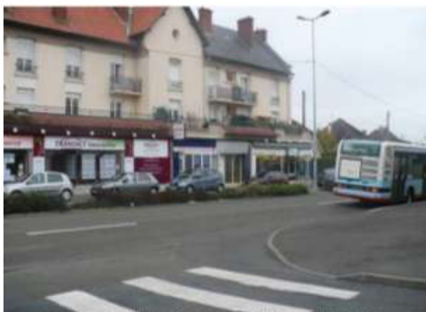
Vue du carrefour de la Rue Saint-Saëns et de l'Avenue Félix Geneslay