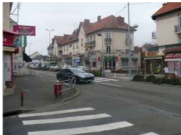
Vue du carrefour de la Rue Saint-Saëns et de l'Avenue Félix Geneslay