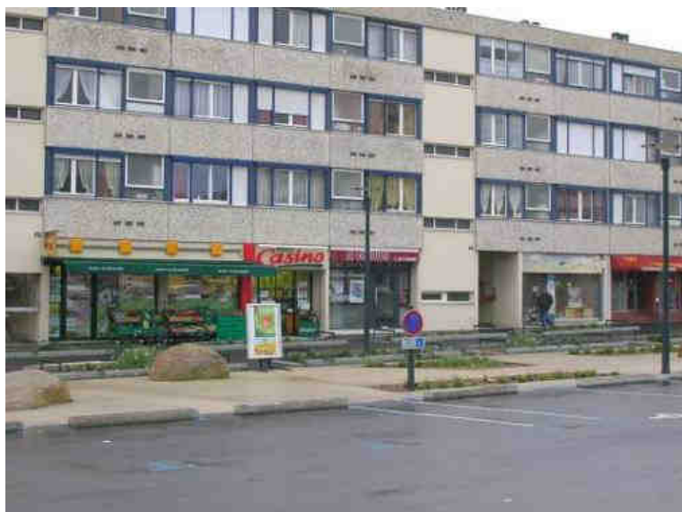
Supérette Petit Casino