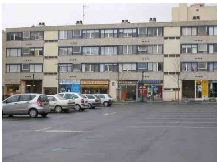
Linéaire commercial vu du parking