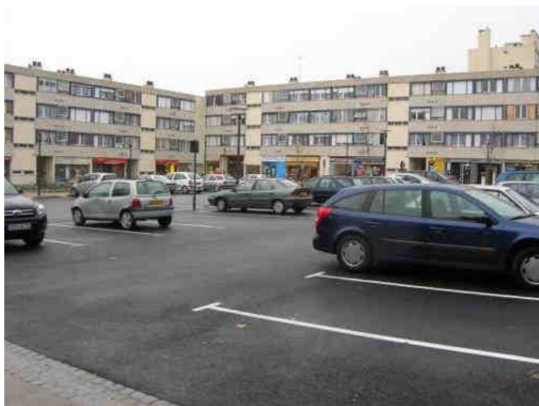
Linéaire commercial vu du parking