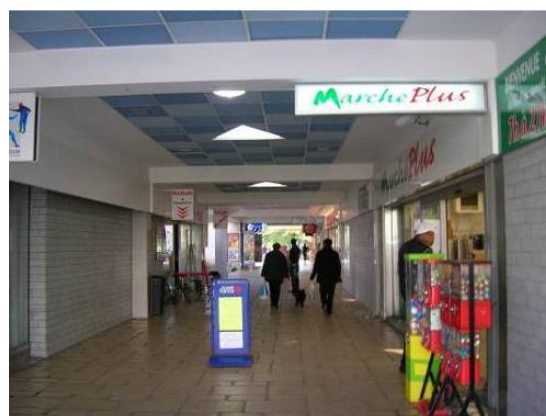
Vue de l'intérieur de la galerie commerciale dont la locomotive alimentaire Marché Plus