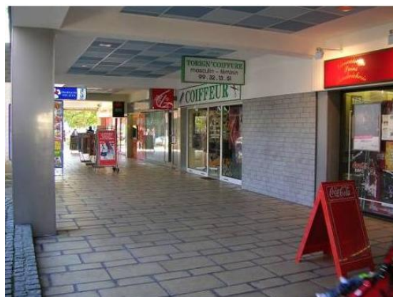
Vue de l'intérieur du centre commercial