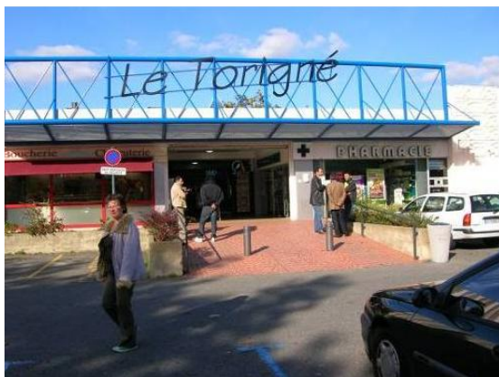
Vue du centre commercial depuis le parking