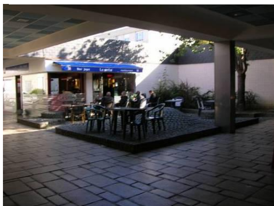
Vue de l'intérieur du centre commercial