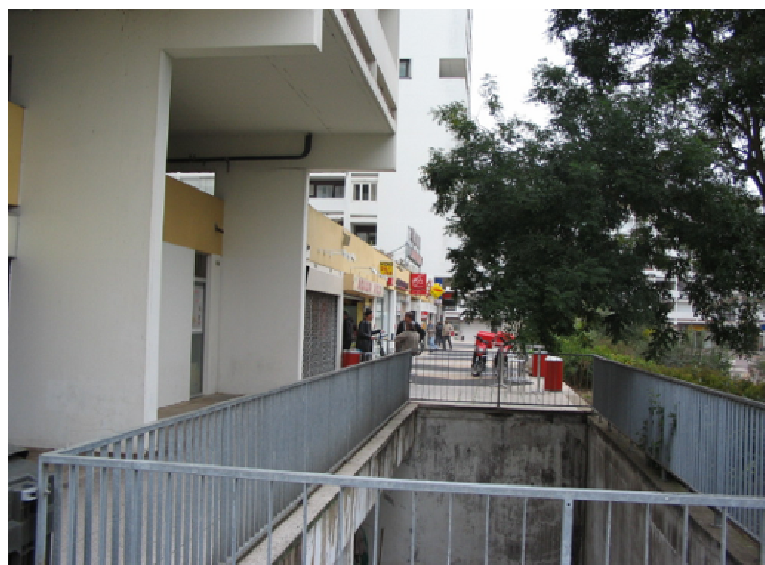
Place de l'Europe – Vue du parking