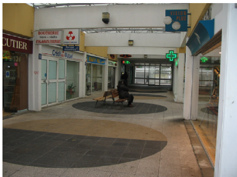
Passage de l'Europe