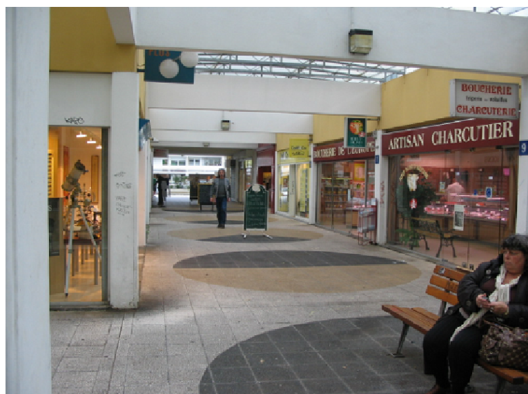
Passage de l'Europe