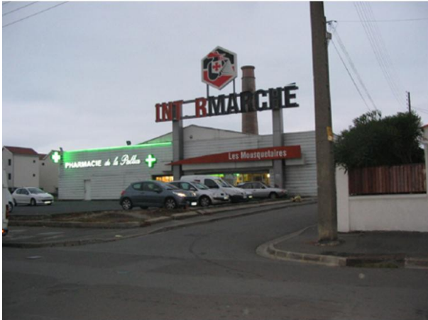
Rue Eugène Dor (Est)