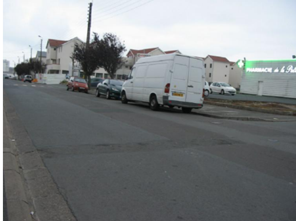
Rue Eugène Dor (Est)