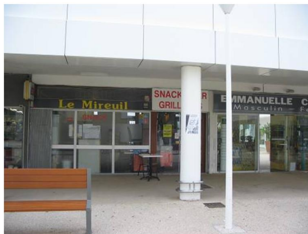
Vue de la place centrale du centre commercial (Sud Ouest) – bar et coiffeur