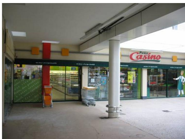
Vue sous le porche du centre commercial (Ouest) – Petit Casino