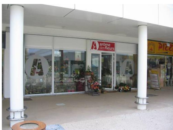
Vue de la place centrale du centre commercial (Sud Ouest) – fleuriste