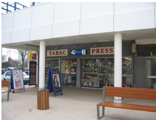
Vue de la place centrale du centre commercial (Sud Ouest) – Tabac presse