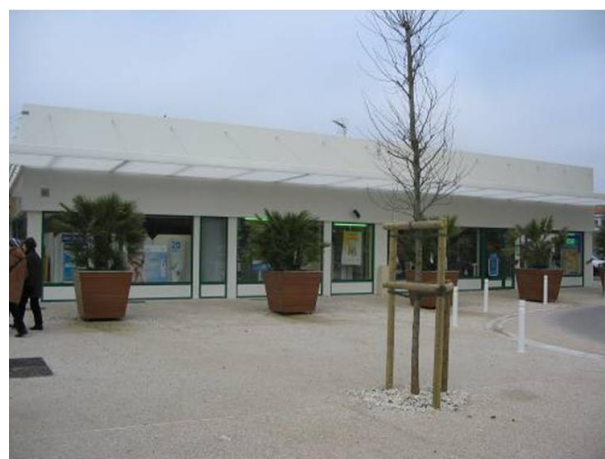
Vue de l'avant de la place centrale – la pharmacie