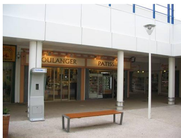
Vue de la place centrale du centre commercial (Ouest) – Boulangerie