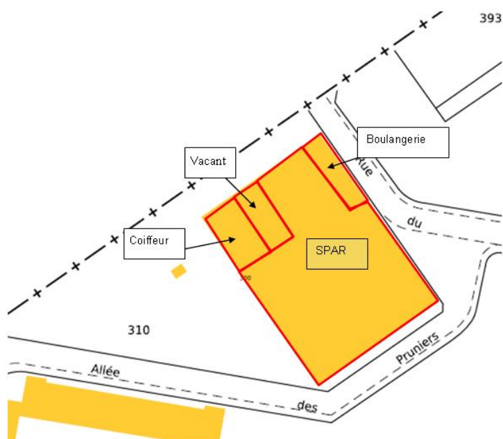
Plan de composition commerciale