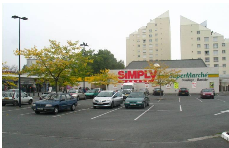
Supermarché Simply Market