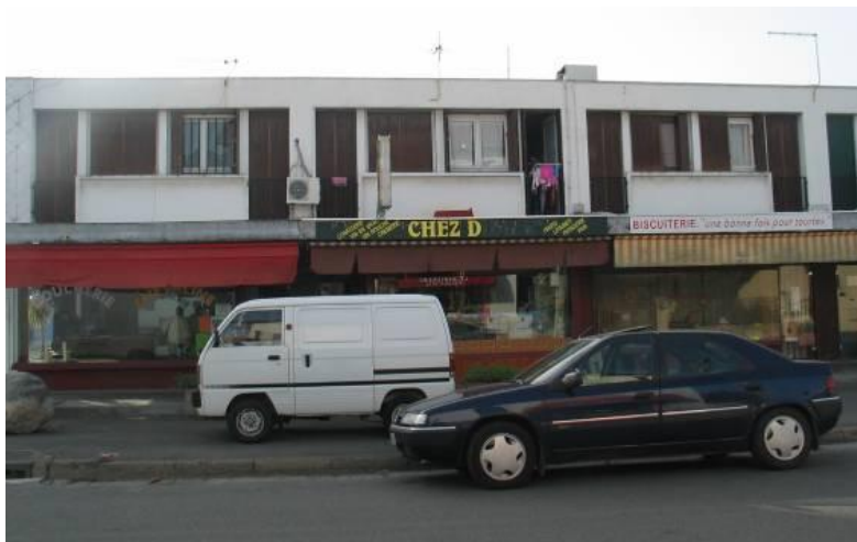
Vue du linéaire commercial depuis la rue de la Libération