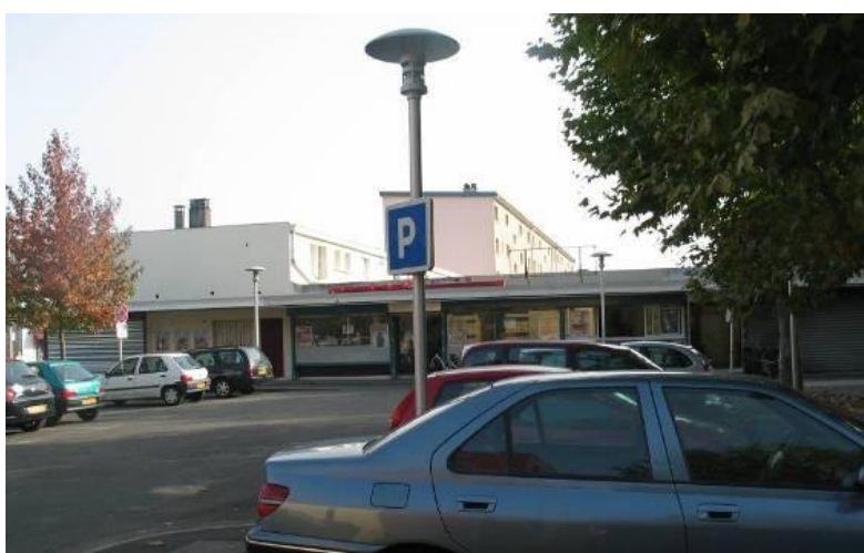
Vue du parking (au nord du pôle)