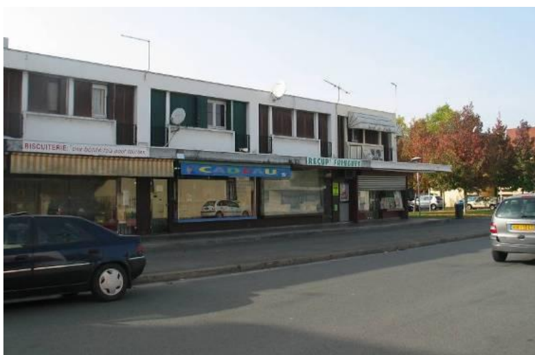
Vue du linéaire commercial depuis la rue de la Libération