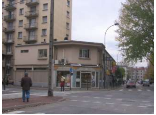
Commerces et services de proximité