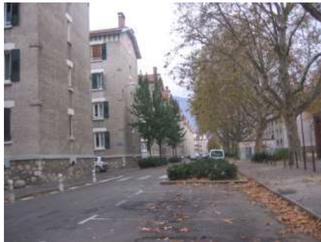
Habitat au nord de la rue Argouges