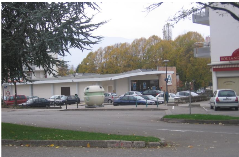
Square Franchet d'Espérey