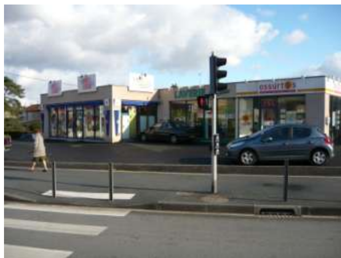
Petit ensemble de commerces au sud de la rue Clémentel