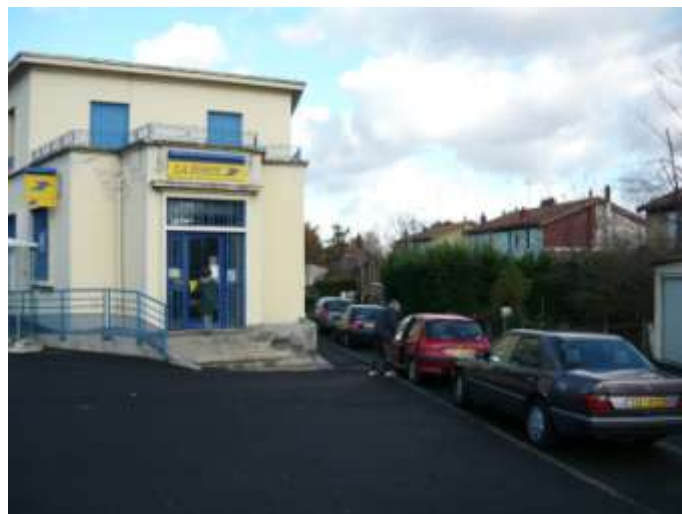
La Poste rue Clémentel