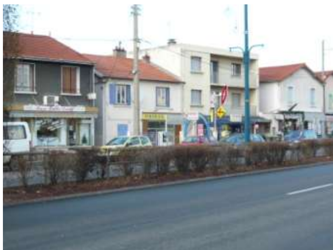
Commerces rue Clémentel