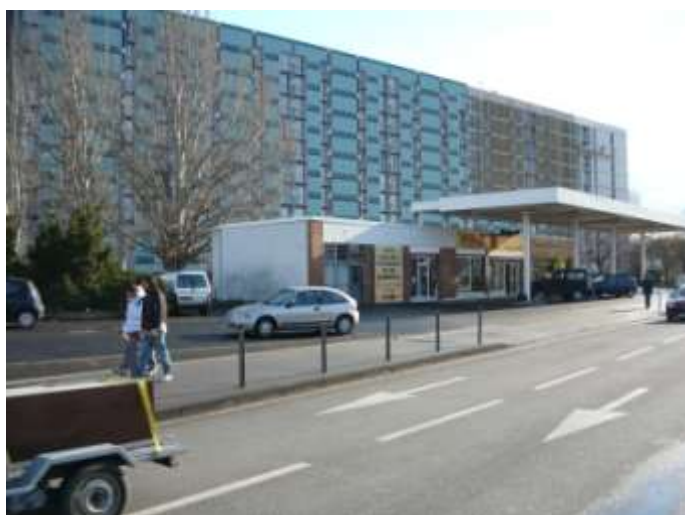
Ancienne station service reconvertie au sud de la rue Clémentel