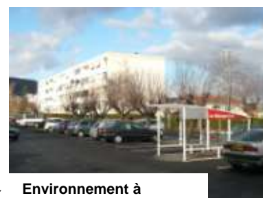
Environnement à l'arrière de l'ensemble