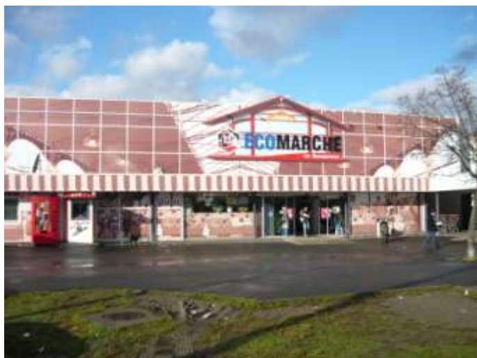
Supermarché « Ecomarché »