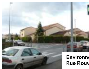
Environnement Rue Rouvier