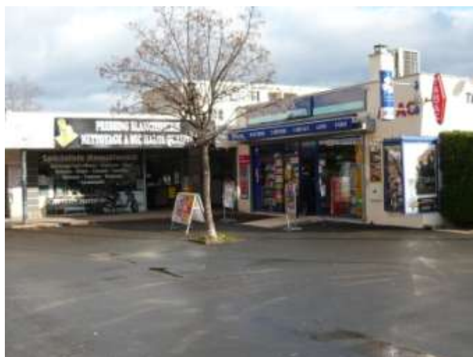
Ensemble de boutiques