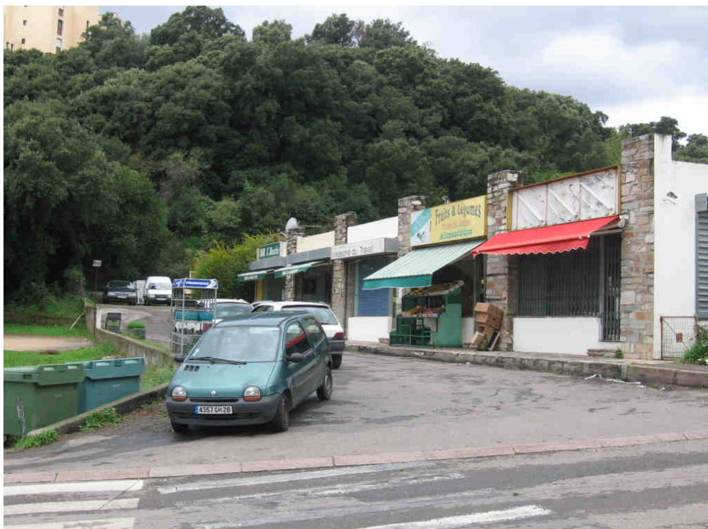
Rue Jean-Pierre Gaffory (Polarité 4)