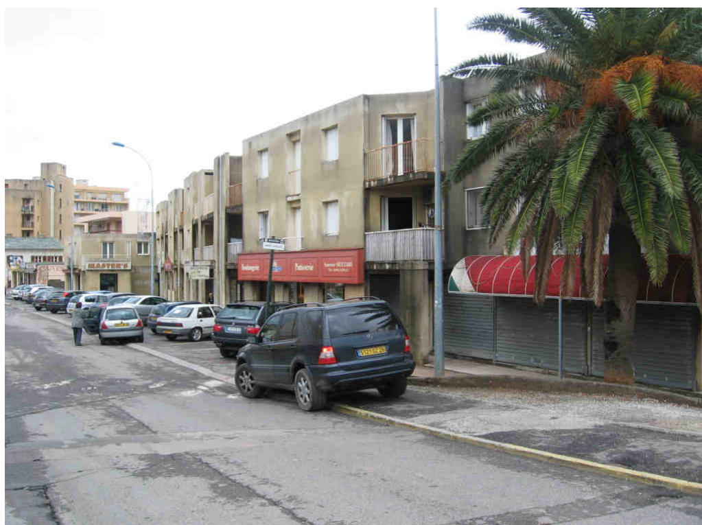
Place de la Poste - Forum Lupino - Rue Jean Gaffory (Polarité 3)