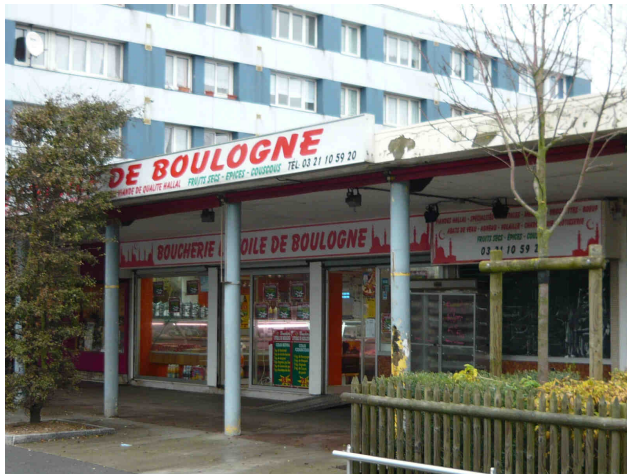
Boucherie "L'Etoile de Boulogne"