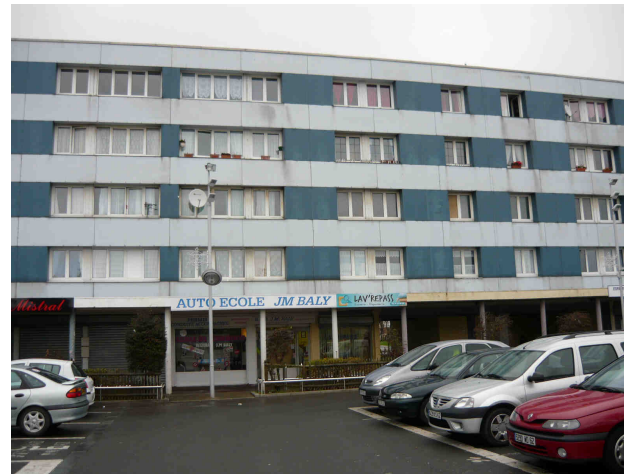
Environnement place Vignon + Auto Ecole Bally et Lav'Repass