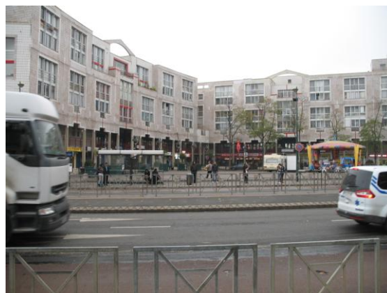
Vue de la Place Louis Aragon