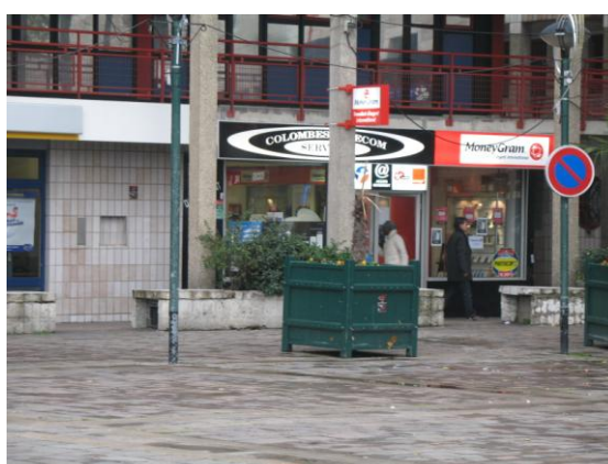
Magasin de téléphonie