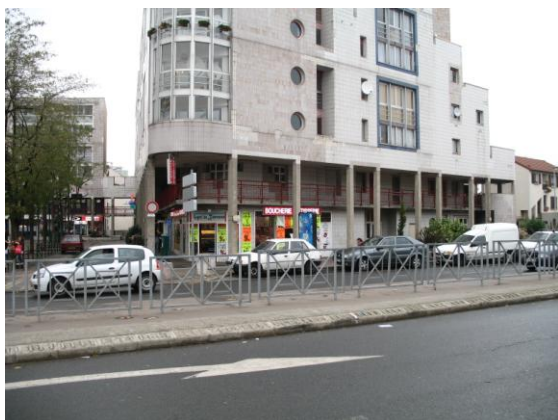
Vue de la Place Louis Aragon